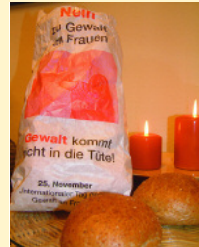
Brötchentütenaktion in Lippstadt.

Gewalt gegen Frauen und Gewalt gegen Kinder hängen eng zusammen. Und die seelischen Folgen Häuslicher Gewalt sind gravierend. Denn nach der oben genannten Studie sind Frauen, die in Kindheit und Jugend selbst Opfer von Misshandlungen in der Familie wurden, dreimal so häufig wie andere Frauen von Gewalt durch den Partner betroffen. Ähnliches gilt für den familiären Hintergrund der schlagenden Männer. Das Verhalten gegenüber ihrer Partnerin und ihren Kindern wird stark durch das geprägt, was in der eigenen Familie vorgelebt wurde. So entstehen ungleiche Machtverhältnisse in der Familie, die zu seelischer oder körperlicher Gewalt führen können. Häusliche Gewalt muss deshalb als gesellschaftliches Phänomen begriffen werden, das alle angeht. Nur dann werden Frauen und Kinder heute geschützt und die Gewalt nicht in die Zukunft transportiert.