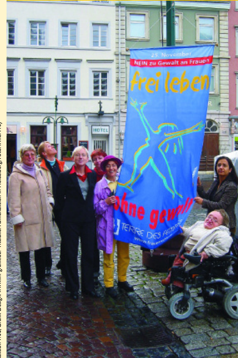
Stand: Fahnenaktion 7/06; Grafik-Design: www.im-grafik.de. Titelbild: Fahnenaktion in Heidelberg.