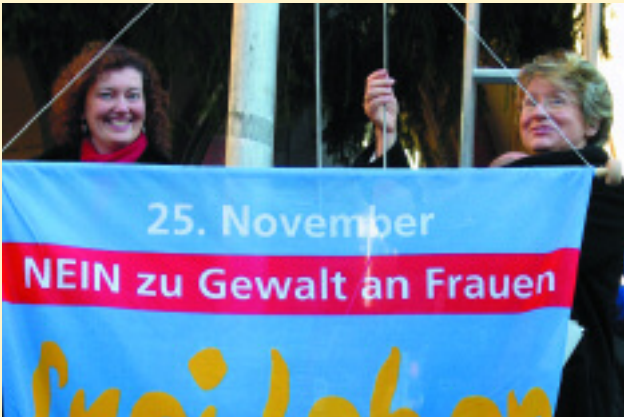
Fahnenaktion in München